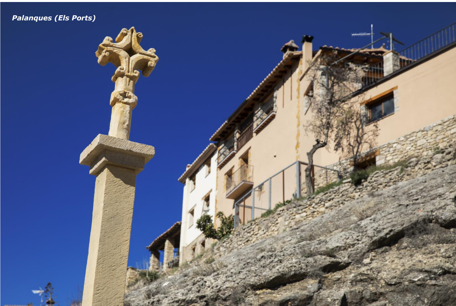
Palanques (Els Ports)

Las visitas se pueden realizar en grupo o de forma individual ya sea en moto, en bici o a pie. Asimismo, por cada etapa superada de la Ruta 99, se ofrecerán diferentes recompensas simbólicas a los visitantes.